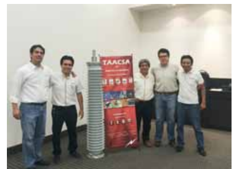
Mérida, Yucatán, México. 2016

Como siempre Agradecemos a todos nuestros invitados y colaboradores su Participación.