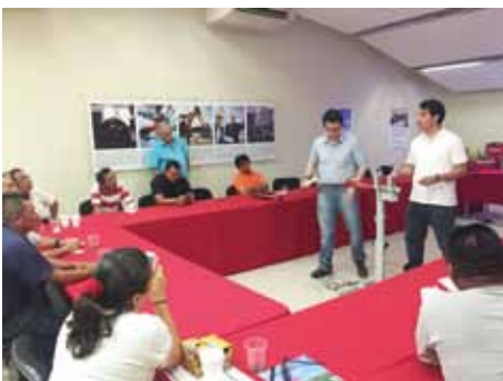
ICIC Yucatán Aula 1.

Y el día 21 presentaron el Taller de Soluciones en Aislamientos de Baja y Media Tensión , donde tuvimos la oportunidad de aprender sobre: