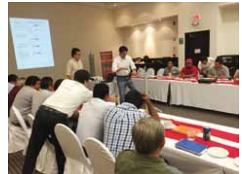
Holiday Inn Express

Y el día 21 presentaron el Taller de Soluciones en Aislamientos de Baja y Media Tensión , donde tuvimos la oportunidad de aprender sobre: